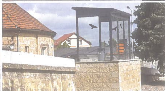
◊Silnice u zastávky autobusu z Theodoru prošla rekonstrukcí. Podél chodníku bylo namontováno i nové zábradlí.