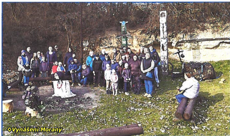
◊ Vynášení Morany