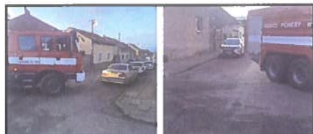
Jeronýmova X Husova