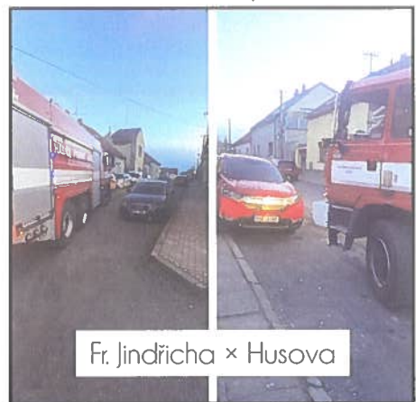
Fr. Jindřicha X Husova