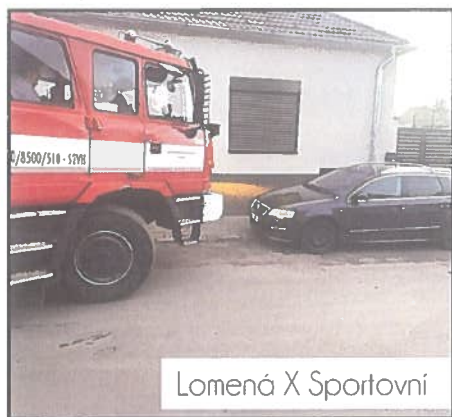
Lomená X Sportovní

Milí Pcheráci, v tomto čísle bych Vás chtěl seznámit se situací k parkování vozidel v ulicích Pcher a Theodoru. Společně s našimi hasiči jsme provedli průzkum (viz foto),