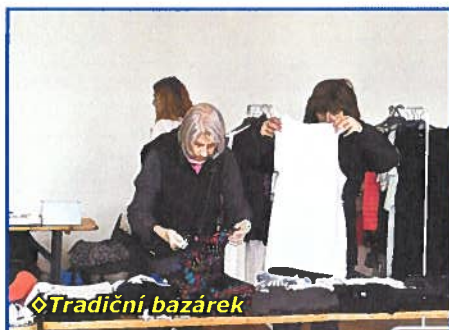
◊ Tradiční bazárek