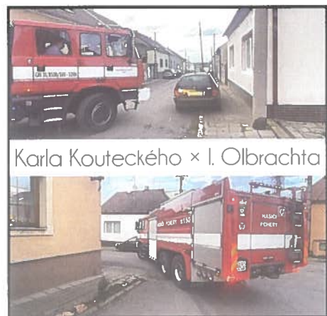
Karla Kouteckého X I. Olbrachta

sun přechodu pro chodce, aby měly děti zajištěnou bezpečnou cestu do školy.