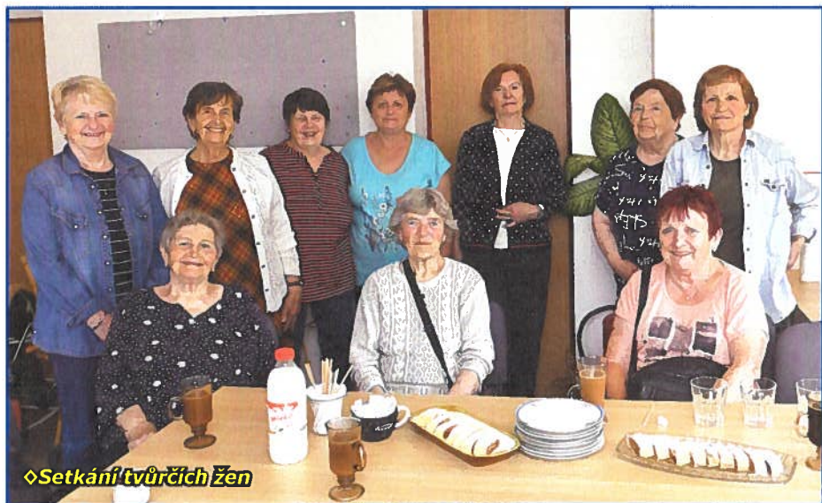
◊ Setkání tvůrčích žen