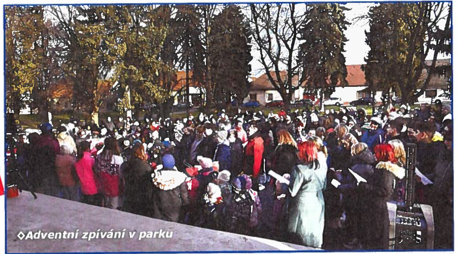
◊Adventní zpívání v parku