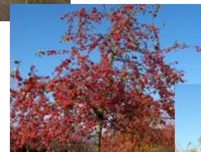
okrasné jabloně s jablky během zimy