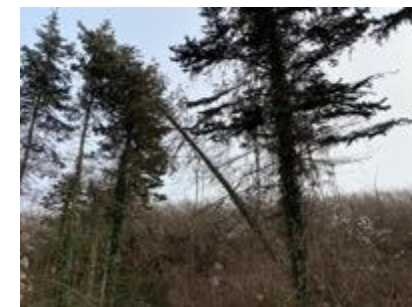
pláně po kůrovci