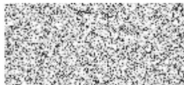
zástupce spolku za příjemce dotace