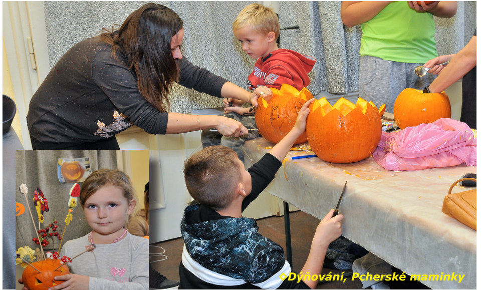
◊ Dytování, Pcherské maminky