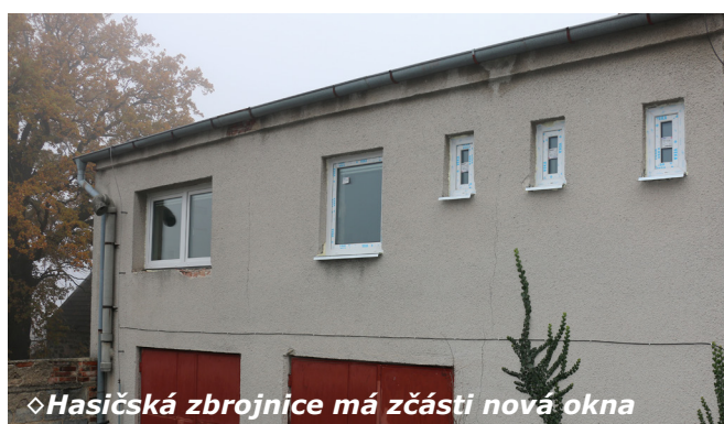
♦Hasičská zbrojnice má zčásti nová okna