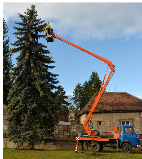
♦Vánoční stromečky ve Pcherách a na Theodoru mají letos novou a bohatší výzdobu. O instalaci se zasloužili pcherští hasiči.