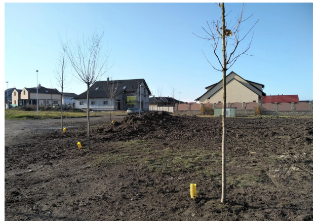
♦ Výsadba sedmi stromů u Dělnického domu.