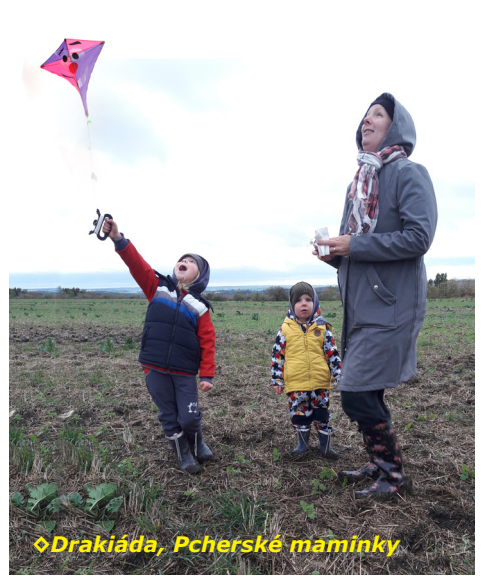
◊ Drakiáda, Pcherské maminky