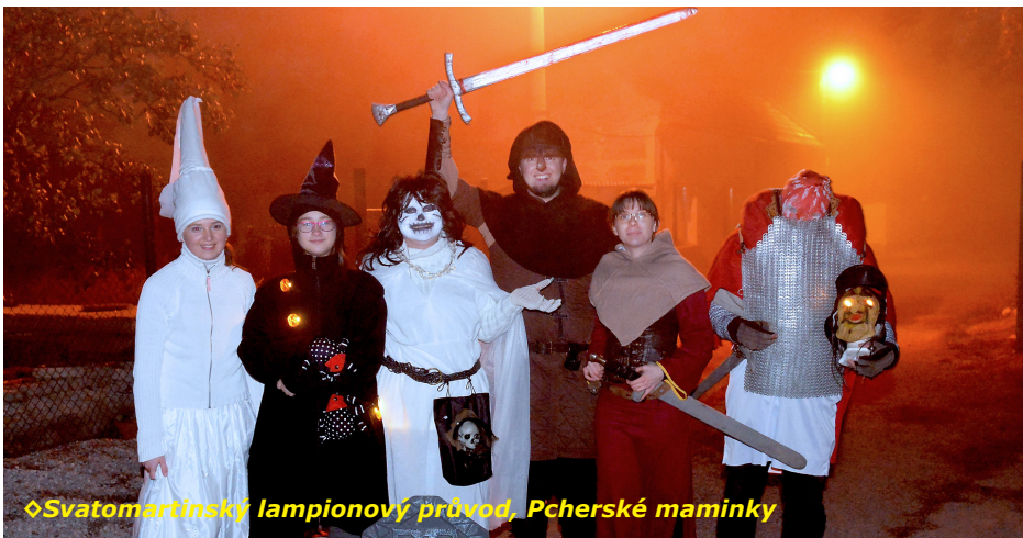
◊ Svatomartinský lampionový průvod, Pcherské maminky